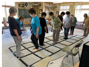
↑「ふまねっと」で、どんぐりコロコロの歌に合わせながら、歩いています。間近で見ると、より綺麗です♪