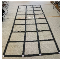
↑「ふまねっとサロン」で使うふまねっと。この網を踏まないように、ゆっくり歩く運動です。失敗しても◎笑いあり、拍手ありで、楽しいですよ♪