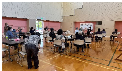
↑「かたつむりカフェ」で、グーパー体操をしている様子。お茶やお菓子を頂きながらの楽しい一時も。