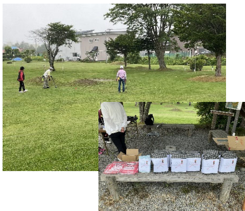
↑「老人クラブパークゴルフ大会」景品も当たりました！皆様、お疲れ様でした。