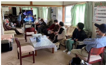
↑「勇愛サロン」カラオケの様子。素敵な歌声が響いていました～♪